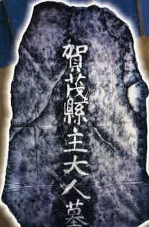
▲品川東海寺大山墓地碑